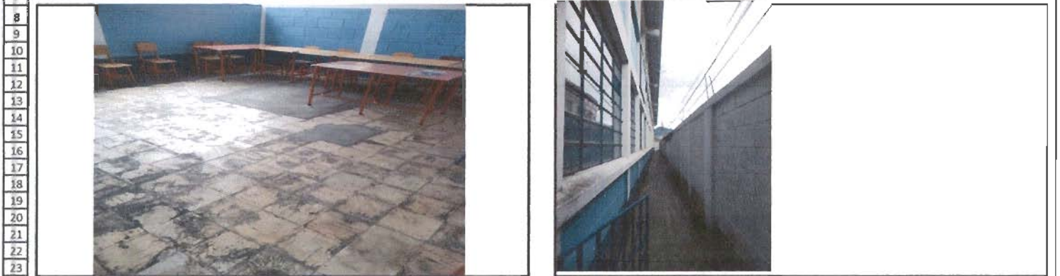
24 Foto1: aula piso en mal estado Foto 2: techado sin canales de bajada agua, salpica y daño paredes de aulas