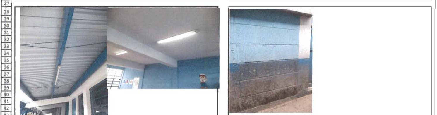
44 Foto 3: lamparas de pasillos y aulas en mal estado y baja iluminación Foto 4: Pared dañada por gotera de techado