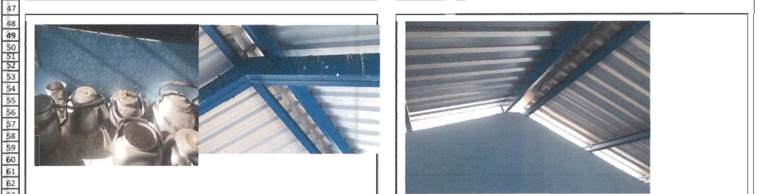
64 Foto 5: Las palomas manchan los materiales y piso de la cocina. Foto 6: palomas ingresan a la cocina para dormir, entran entre pared y techo. Se necesita cerrar espacios vacios.

68 Observación: Si es necesario se pueden agregar hojas adicionales y actualizar el número de hojas. 69 Firma y sello del Presidente de la OPF Firma y Sello Director Centro Educativo Público 70 71 72