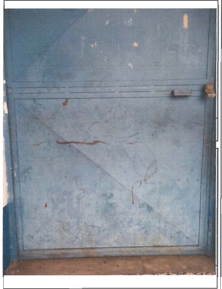
foto 7. todas las puertas en mal estado, necesitan lijado y pintura,

Observación: Si es necesario se pueden agregar hojas adicionales y actualizar el número de hojas.